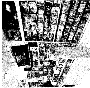
ОСТАТКОВ СЕТИ «НАСТРОЕНИЕ» не хватило для погашения долгов перед банками